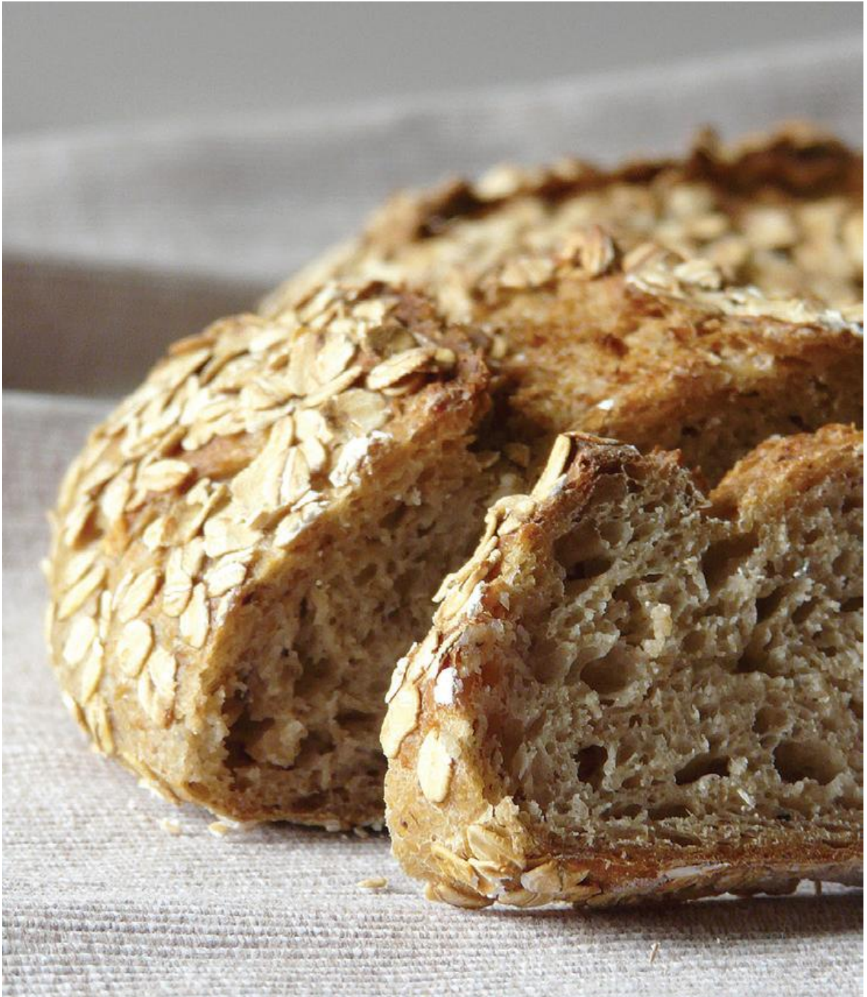
Figura 2: O uso das leveduras na massa do pão (acrescentadas na forma de um tablete de fermento que